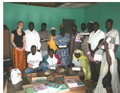
Die Übergabe des Schulmaterials

Schulferien in Benin sind und nicht alle Schüler im Dorf waren, müssen die Schüler des FEG noch etwas auf ihre Antwortbriefe warten. Mit Hilfe der Spenden, die die Schüler des FEG beim letzten Schulbasar gesammelt haben, konnten wir dringend benötigtes Schulmaterial für die Dorfschule Sérou kaufen. Nach Absprache mit dem Direktor der Schule haben wir Schulbücher, Arbeitshefte und