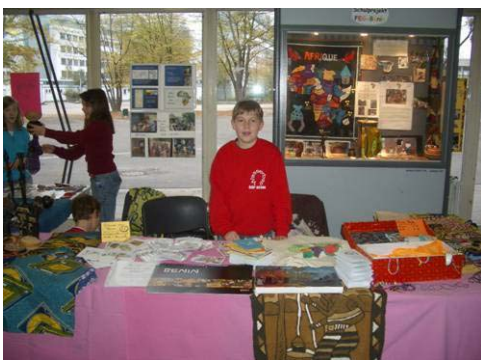
Benin Basar am FEG

zu sammeln. Bei den beiden Basaren wurden über 1400 € Spenden für Baobab Benin e.V. eingenommen. Das Geld fließt in die Schulprojekte in Sérou und Dogué.