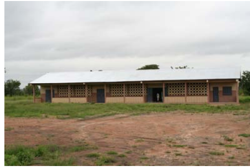
Die Schule in Dendougou

Von Seiten des Dorfes Dendougou besteht großes Interesse an einer Schulpartnerschaft mit einer Deutschen Schule. Daher suchen wir noch eine Schule (bzw. Klasse einer Schule),