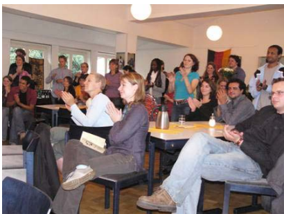
Gründungsfeier in der Trinitatiskirche