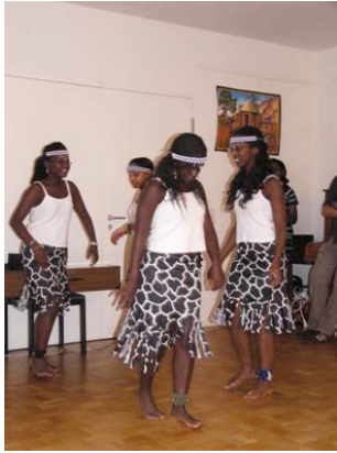
Die Tanzgruppe Umucyo

Die Bilanz des Abends fällt sehr positiv aus. Wir haben uns sehr über das große Interesse